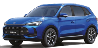
● MODRÁ COMO METALICKÝ LAK 16 500 Kč