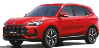
● ČERVENÁ DIAMOND METALICKÝ LAK 16 500 Kč