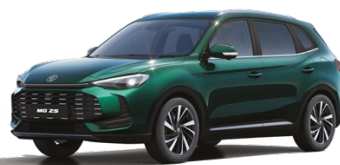
● ZELENÁ EMERALD METALICKÝ LAK 16 500 Kč