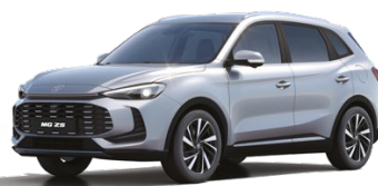
○ STŘÍBRNÁ COSMIC METALICKÝ LAK 16 500 Kč