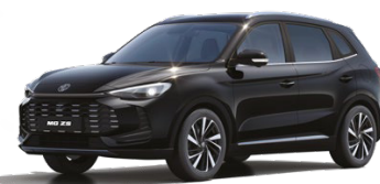
● ČERNÁ PEBBLE METALICKÝ LAK 16 500 Kč