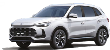
○ BÍLÁ DOVER ZÁKLADNÍ LAK