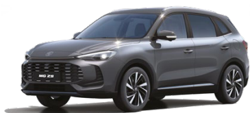
● ŠEDÁ HAMPSTEAD METALICKÝ LAK 16 500 Kč