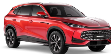
● ČERVENÁ DIAMOND METALICKÝ LAK 18 500 Kč