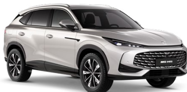
○ STŘÍBRNÁ STERLING METALICKÝ LAK 18 500 Kč