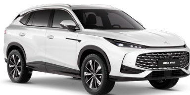
○ BÍLÁ PEARL METALICKÝ LAK 18 500 Kč