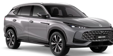
● ŠEDÁ HAMPSTEAD METALICKÝ LAK 18 500 Kč