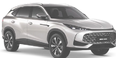
○ STŘÍBRNÁ STERLING METALICKÝ LAK 18 500 Kč