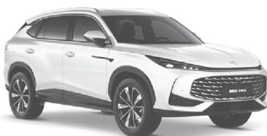
○ BÍLÁ PEARL METALICKÝ LAK 18 500 Kč