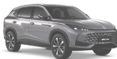
● ŠEDÁ HAMPSTEAD METALICKÝ LAK 18 500 Kč