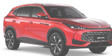
● ČERVENÁ DIAMOND METALICKÝ LAK 18 500 Kč