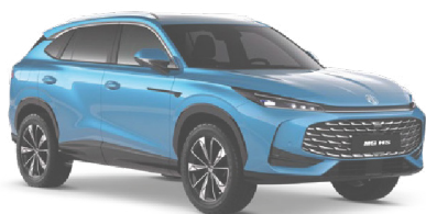
● MODRÁ ARCTIC ZÁKLADNÍ LAK