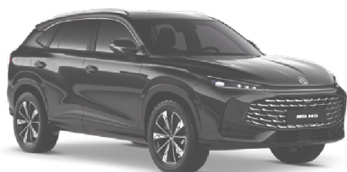
● ČERNÁ PEBBLE METALICKÝ LAK 18 500 Kč